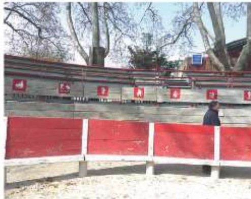
Reproduction de 180 ans d'empègues dans le arènes

Pour la semaine bleue en octobre 2022, un après-midi a été consacré à la présentation des empègues, de leur origine à nos jours, suivi d'un échange avec nos aînés. Leurs souvenirs ont bien complétés nos connaissances sur celles propre à Beauvoisin. L'idéal serait maintenant qu'un écrivain, inspiré par le sujet, rassemble documents, photos et souvenirs dans un livre, avec le concours de tous.