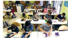
Atelier pochon Ecole de Beauvoisin