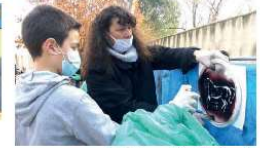
Ecole Beauvoisin atelier bombe