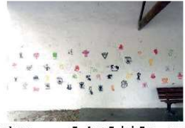
Empègues Ecole de Franquevaux