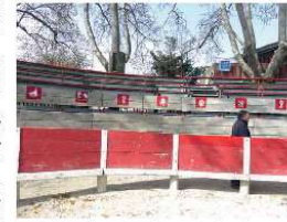
Reproduction de 180 ans d'empègues dans le arènes

Pour la semaine bleue en octobre 2022, un après-midi a été consacré à la présentation des empègues, de leur origine à nos jours, suivi d'un échange avec nos aînés. Leurs souvenirs ont été complétés nos connaissances sur celles propres à Beauvoisin. L'idéal serait maintenant qu'un festival, inspiré par le sujet, rassemble documents, photos et souvenirs dans un livre, avec le concours de tous.