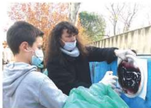
Ecole Beauvoisin atelier bombe