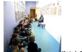
Fillette des Empègues