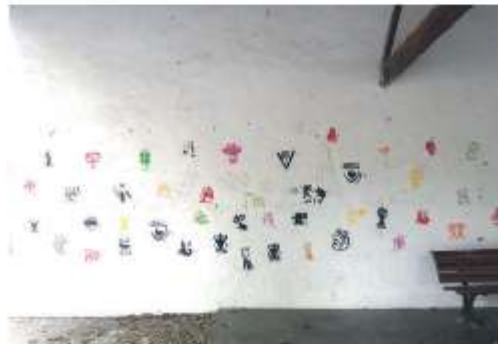
Empègues Ecole de Franquevaux