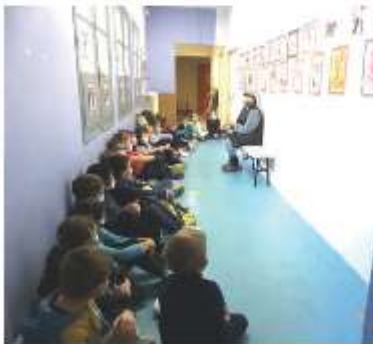
Histoire des Empègues