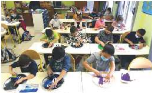
Atelier pochoir Ecole de Beauvoisin